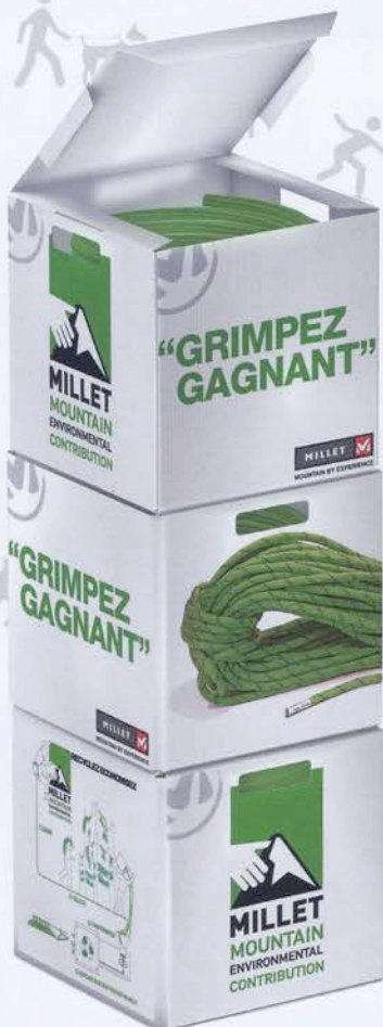
Kit collecte cordes Millet